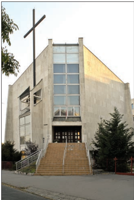
1. kép. Vízafogói Szent Márton-templom (M. A.)

vásárolt az egyházközség. 1952-ben tárgyalások után a telkeket és a rajta levő kápolnát az épülő lakótelep számára államosították. A lelkészség kárpótlás után kápolnáját visszahelyezte oda, ahonnan egykor kiindult, a Frangepán utca 4. számú ház alagsorába.