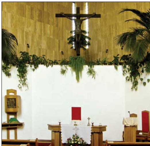
2. kép. Vizafogói Szent Márton-templom oltára

2006-ban került elhelyezésre a templom előtti kis kertben egy fából faragott Kopja a magyar hősök és 1956-os forradalom emlékére.